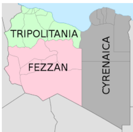
1-rasm. Liviyaning uch mintaqaga bo'linishi